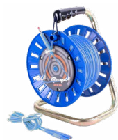
Cavo 75 / 100 / 200 m sulla bobina per misure di terra blu WAPRZ075BUBBSZ WAPRZ100BUBBSZ WAPRZ200BUBBSZ