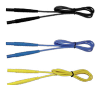
Cavo 1,2 m CAT III/1000V CAT IV/600V nero / blu / giallo WAPRZ1X2BLBB WAPRZ1X2BUBB WAPRZ1X2YEBB