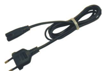
Cavo di alimentazione 230 V (pin IEC C7) WAPRZLAD230