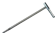
2x sonda da piantare nel suolo (30 cm) WASONG30