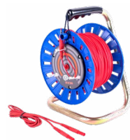
Cavo 75 / 100 / 200 m sulla bobina per misure di terra rosso WAPRZ075REBBSZ WAPRZ100REBBSZ WAPRZ200REBBSZ