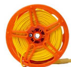
Cavo 50 m sulla bobina per misura di terra (terminale banana) giallo WAPRZ050YEBBSZ