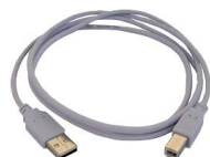
Cavo per trasmissione dati USB WAPRZUSB