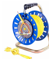
Cavo 75 / 100 / 200 m sulla bobina per misure di terra giallo WAPRZ075BUBBSZ WAPRZ100YEBBSZ WAPRZ200YEBBSZ