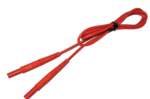
Cavo 1,2 m (terminali banana) rosso WAPRZ1X2REBB