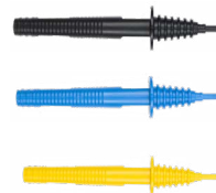
Terminale a puntale CAT III/1000V CAT IV/600V nera / blu / gialla WASONBLOGB1 WASONBUOGB1 WASONYEGB1