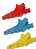
Terminale a cocco-drillo 1 kV 20 A rosso / blu / giallo WAKRORE20K02 WAKROBU20K02 WAKROYE20K02