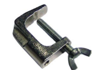
Morsetto a vite (terminale banana) WAZACIMA1